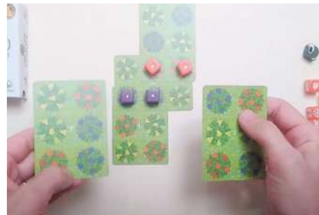
Le carte di "Orchard", gioco ambientato in un frutteto