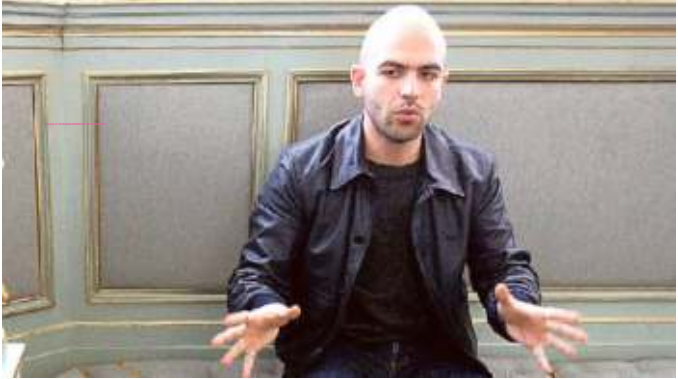
Dall'alto: Roberto Vecchioni inaugura oggi gli incontri della libreria Ubik; tra i prossimi ospiti l'ex direttore di "Repubblica", Mario Calabresi (19 gennaio) e lo scrittore e giornalista Roberto Saviano (27 gennaio)